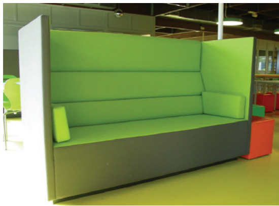
referentie technasium Lelystad